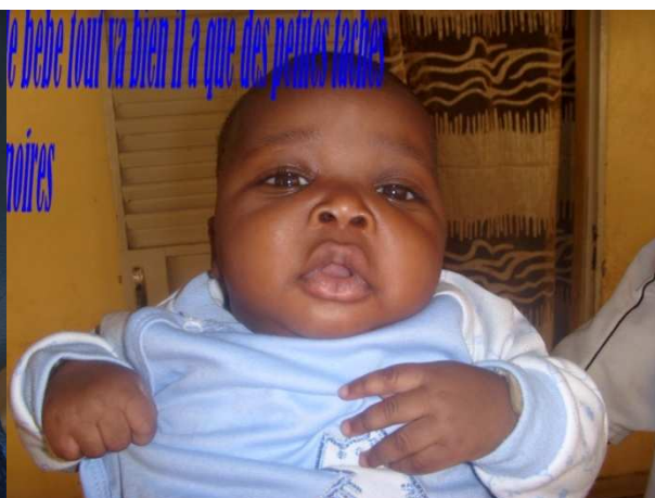
Notre bébé est guéri