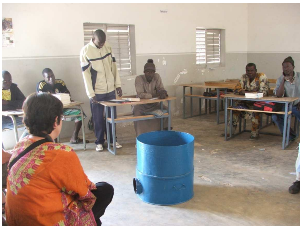
La livraison du fourneau