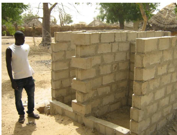
Abbé surveille la construction des toilettes