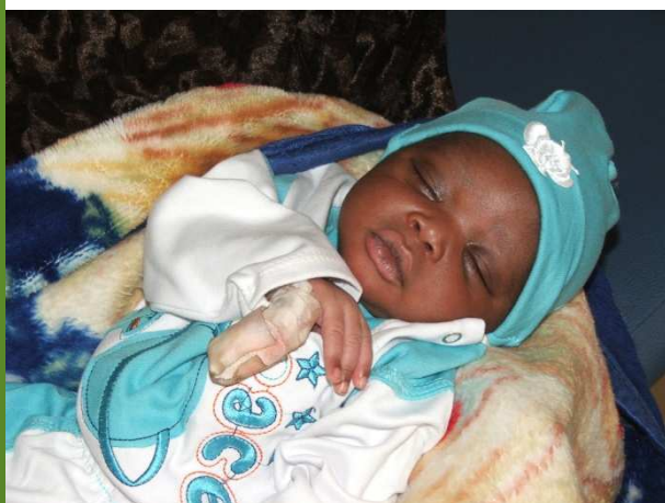
Notre plus jeune opéré (1 jour)