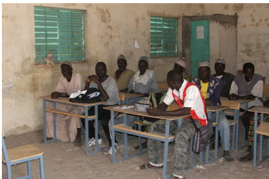
Réunion à l'école

Une table ronde a été organisée à l'école avec le Chef de Village, les conseillers ruraux, les représentants des parents d'élèves, le Directeur de l'école, les enseignants, le coordinateur de projets ATD3S et moi-même afin de faire le point sur les réalisations des dernières années et sur les projets : échanges très riches.