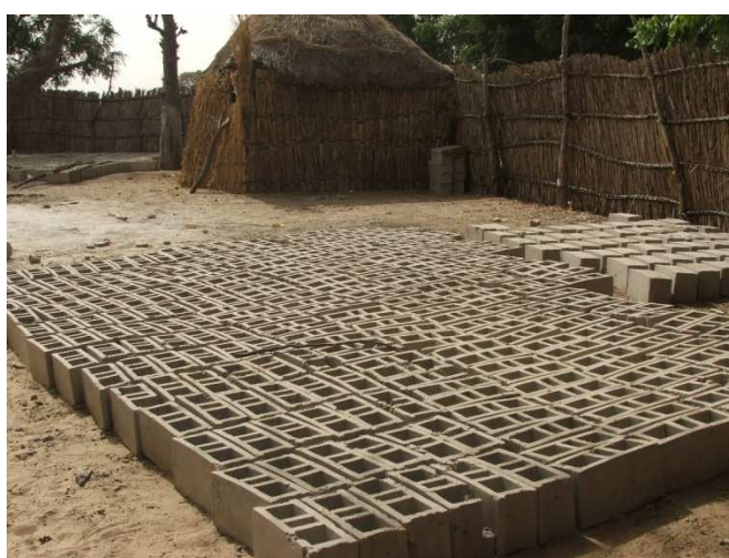
Les parpaings sont prêts à l'emploi