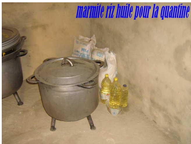
La marmite à riz

Pour le projet des toilettes nous attendons la prochaine mission pour une éventuelle réalisation.