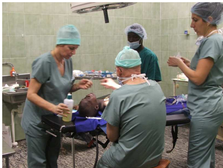
En salle d'opération