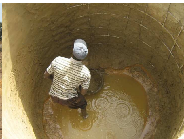
Le puits se termine