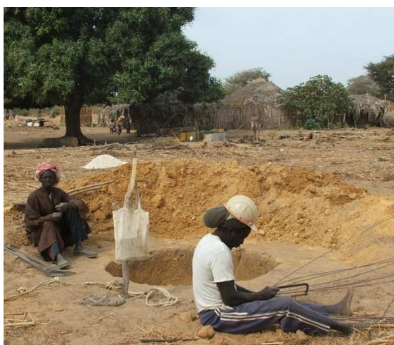
Le puisatier au travail